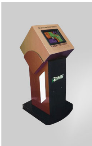
KIOSK „PROJEKT 1”

Projekt kiosku informacyjnego dla Urzędu Miasta w Sokółce Podlaskiej. Opracowanie i przygotowanie aplikacji dla kiosku, udostępniającej strony internetowe Urzędu.