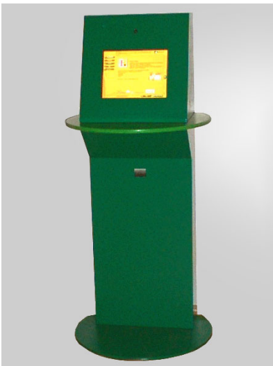
KIOSK „MAGIT 5”

Przygotowanie kiosku informacyjnego dla Akademii Polonijnej w Częstochowie.