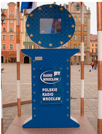
„BRAMA DO EUROPY”

Firma Magit dostarczyła Polskiemu Radiu Wrocław kiosk informacyjny, wykorzystany w specjalnym przedsięwzięciu nazwanym Brama do Europy .