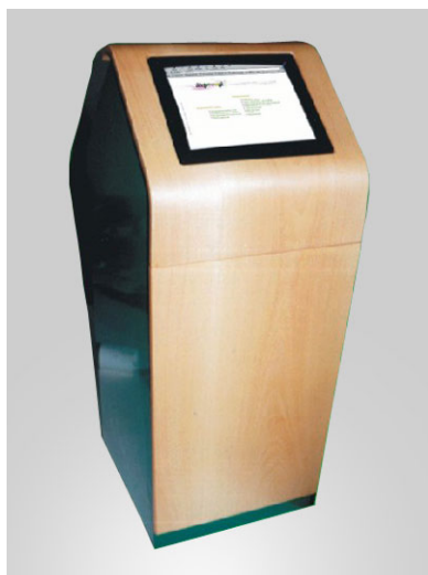
KIOSK „MAGIT 1”

Wykonanie kiosku informacyjnego dla Urzędu Miejskiego w Czarnkowie oraz opracowanie i wykonanie prezentacji multimedialnej zainstalowanej w kiosku.