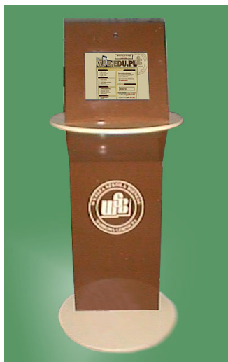
KIOSK „MAGIT 5”

Projekt i wykonanie kiosku informacyjnego dla potrzeb Wyższej Szkoły Biznesu w Dąbrowie Górniczej.