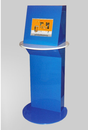
KIOSK „MAGIT 5”

Wykonanie kiosków do obsługi Urzędów Pracy, w ramach projektu pod patronatem Ministerstwa Gospodarki, Pracy i Polityki Społecznej.