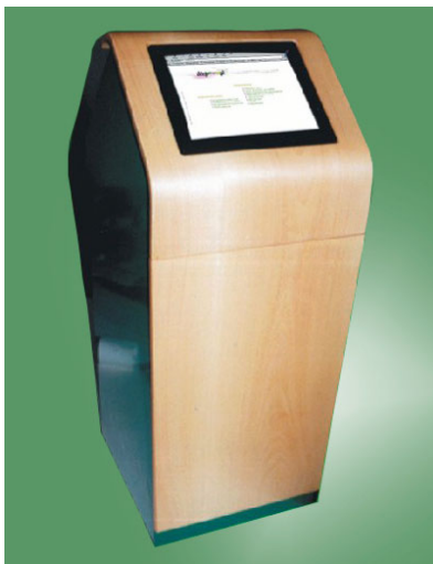
KIOSK „MAGIT 1”

Przygotowanie projektu i wykonanie kiosku informacyjnego, pracującego na terenie Muzeum Narodowego w Szczecinie.