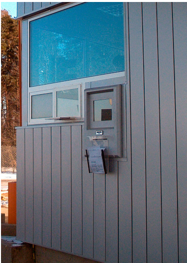
KIOSK „MAGIT 2”

Opracowanie i wykonanie dla firmy Giga kiosków zewnętrznych typu bankomat, pracujących w systemie wspomagającym obsługę stacji dystrybucji paliw Naftobazy Boronowo.