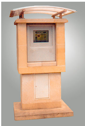
KIOSK „MAGIT 2”

Kiosk informacyjny typu Magit Standard 2 (bankomat) wykonany dla Urzędu Miasta w Żorach, prezentujący zawartość stron internetowych Urzędu.